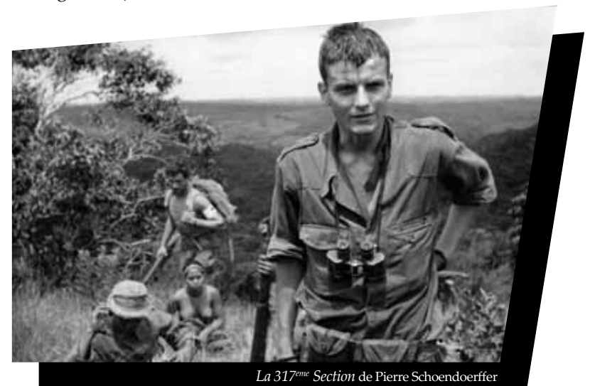
La 317 ème Section de Pierre Schoendoerffer

Jacques Perrin à propos de l'expérience de La 317 ème Section