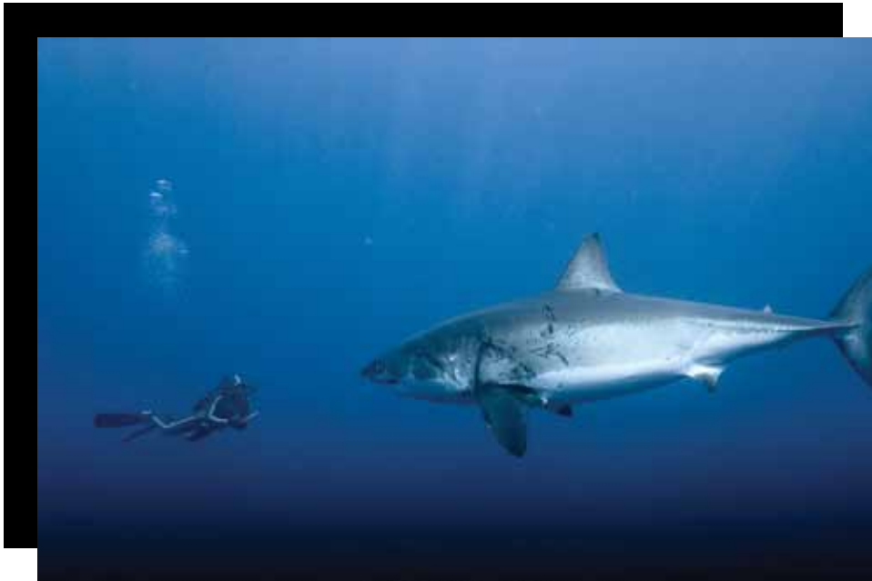
Océans de Jacques Perrin

« Dès cette époque, j'ai compris que l'ailleurs n'existait pas. Quand on est très loin, on chemine un peu plus déboussolé, mais on trimbale toujours la même carcasse. Ce qui m'intéresse vraiment, c'est le voyage que l'on fait auprès des autres ici ou au bout du monde. »